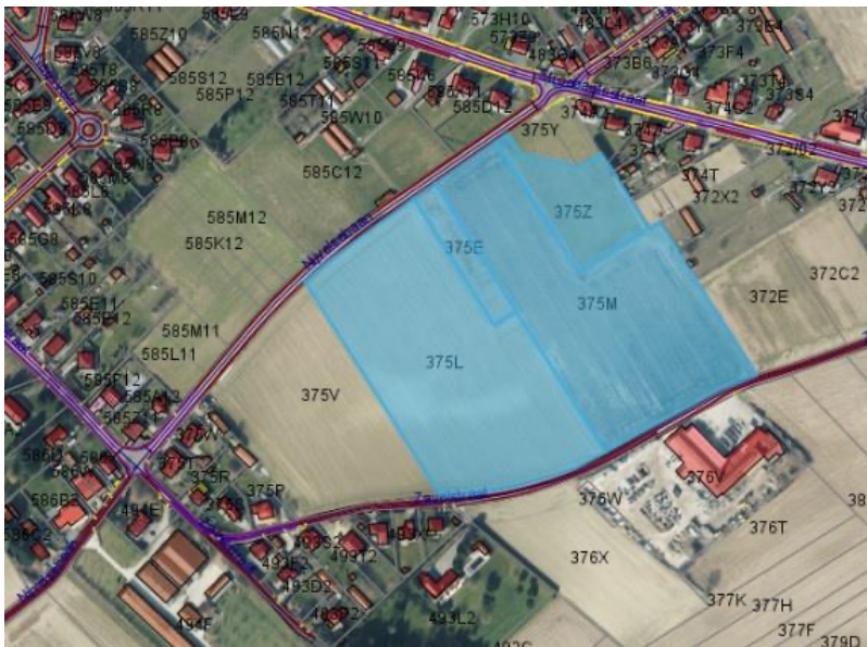
Site Van Bever op de Zavelstraat (5,5 ha)

Door het ANB kreeg de onderstaande site een positief advies.